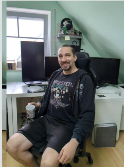
Arbeitsplatz bei Münster