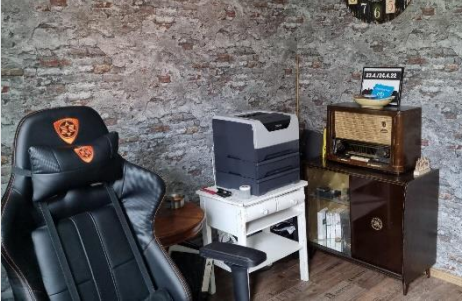
Heim-Arbeitsplatz in Seesen